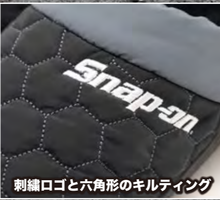
刺繍ロゴと六角形のキルティング