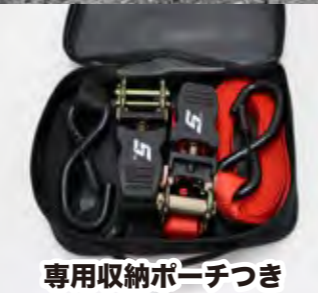
専用収納ポーチつき

留め具部分の S ロゴと、ベルト部分に等間隔でプリントされた定番ロゴが特徴のラッシングベルトです。耐荷重約1トンで、フックは樹脂でコーティングされています。ピッタリ入る専用ポーチ付き。